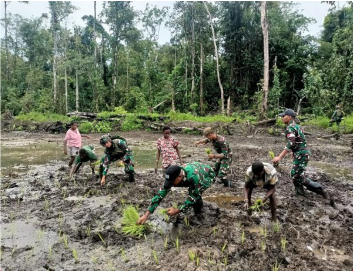
Foto: Satgas Pamtas Mobile RI-PNG Yonif 503/Mayangkara menggagas program ketahanan pangan yang melibatkan langsung warga Kampung Mumugu, Distrik Krepkuri, Kabupaten Nduga, Selasa (07/01/2025).